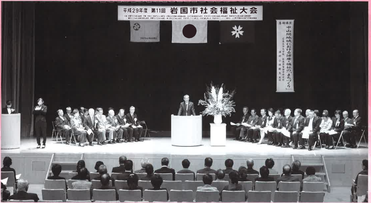
平成29年度 第11回 岩国市社会福祉大会