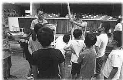
児童福祉活動の推進