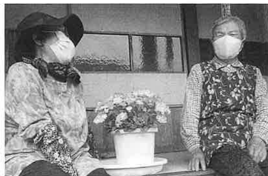
～ 生活支援体制整備事業 高齢者生きがいボランティアグループ ～

福祉用具の無償貸出事業の実施 サロンやイベント等におけるレクリエーション 用具等の無償貸出事業の実施