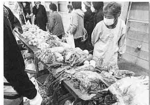
～ 福祉の市 ～