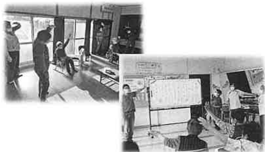
高齢者福祉の推進