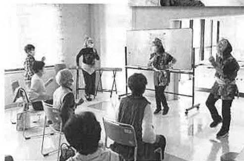
～ ふれあいいきいきサロン ～