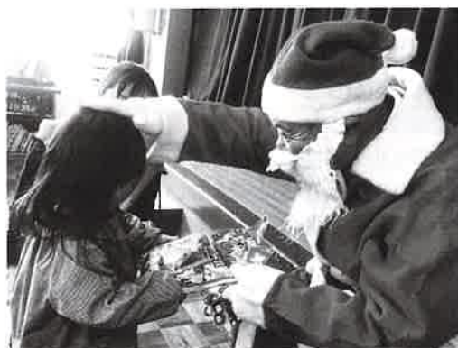
園児クリスマス会風景

この行事を通じ、日本の将来を担う大切な子どもたちの道徳教育や健全育成に努めています。