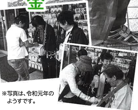
※写真は、令和元年のようすです。