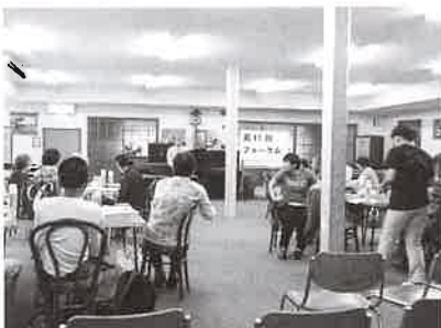
障害者団体活動支援