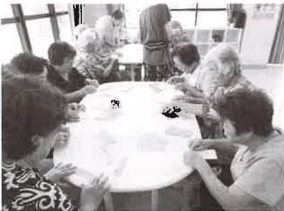
高齢者を考える地域づくり