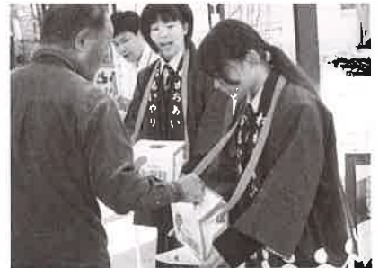
ボランティア活動の推進