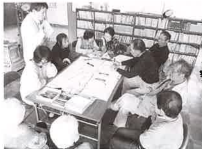
住みよいまちづくりの推進