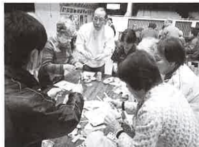
各種相談・講座・貸付事業