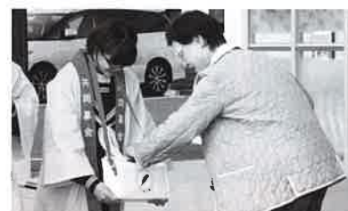
歳末たすけあい街頭募金