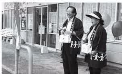
赤い羽根街頭募金

令和元年度における赤い羽根共同募金・歳末たすけあい募金額 （玖珂町の皆様からの善意の募金総額 3,366,556円 ）