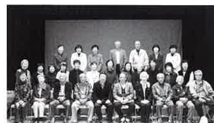
本郷ボランティア 連絡協議会との交流会

（例）玖珂町ボランティア連絡協議会活動支援、ボランティア活動諸事業、ボランティア交流会など