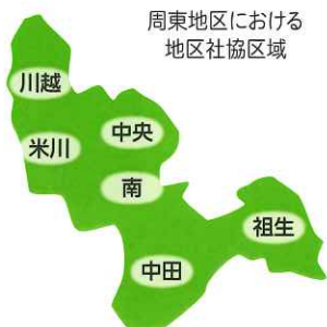
周東地区における 地区社協区域

「地区の福祉推進主団体」としての活躍が期待されています。各地区社協は、地区の敬老行事や地区文化祭、青少年育成活動や地域奉仕作業など幅広い行事に企画されています。