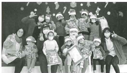
園児クリスマス会風景

この行事を通じ、日本の将来を担う大切な子どもたちの道徳教育や健全育成、共同募金運動のPR活動等に努めています。