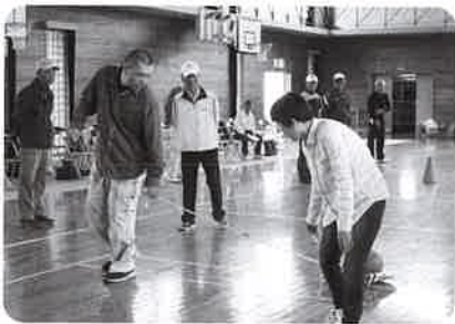
「いきいきスポーツ交流のつどい」