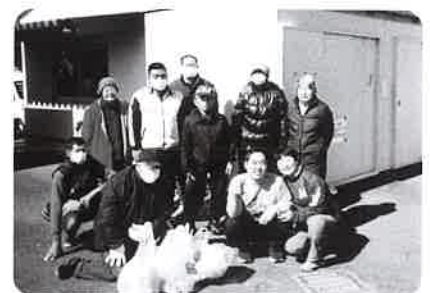
クリーン作戦（ささみ川周辺の清掃活動）