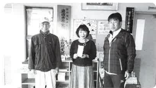
イベント募金 (赤い羽根チャリティグラウンドゴルフ大会)