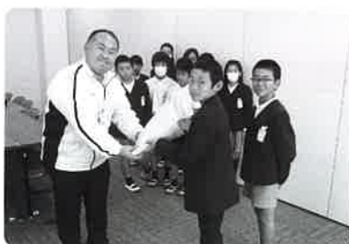
玖珂小学校の皆様より12,482円の募金をいただきました。