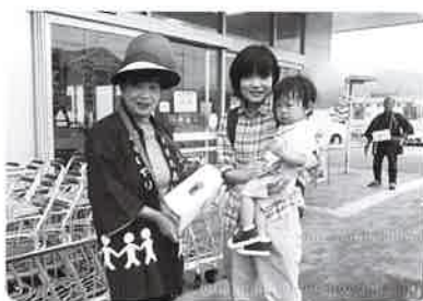
令和元年10月1日(火) マックスバリュ玖珂店にて赤い羽根街頭募金を行いました。当日は、9,381円の募金が集まりました。