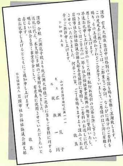
《仏式の挨拶状例葉書サイズの裏面》

香典（玉串料）返しおよび見舞返しに代えてご寄付いただいた場合、必要に応じて挨拶状の印刷を無料でさせていただきます。 ご寄付の際にお申し出ください。