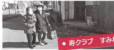
● 寿クラブ すみれ会