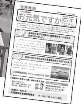
◆ 柱島地区 「くらしの情報紙」

既に協議体設置済の地区でも会議が開催され、助け合いの仕組みづくりや高齢者への情報提供が行われました。