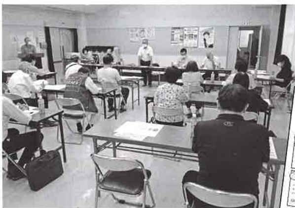
◆ 岩国地区ご近所ささえ合い会議

住み慣れたまちで安心して暮らせる地域づくりを話し合う「ご近所ささえ合い会議」(協議体)が、令和4年度は新たに岩国地区、麻里布地区、室の木地区、山手地区に設置され、21地区となりました。