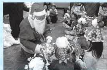
園児クリスマス会風景

この行事を通じ、日本の将来を担う大切な子どもたちの道徳教育や健全育成に努めています。