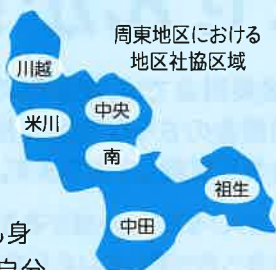
周東地区における 地区社協区域

「地区社協」は地域住民に最も身近な社協として、住民同士が自分たちの地域の様々な課題を受け止め、解決に向けて協議し活動を推進する「地区の福祉推進主団体」としての活躍が期待されています。各地区社協は、地区の敬老行事や地区文化祭、青少年育成活動や地域奉仕作業など幅広い行事に参画されています。