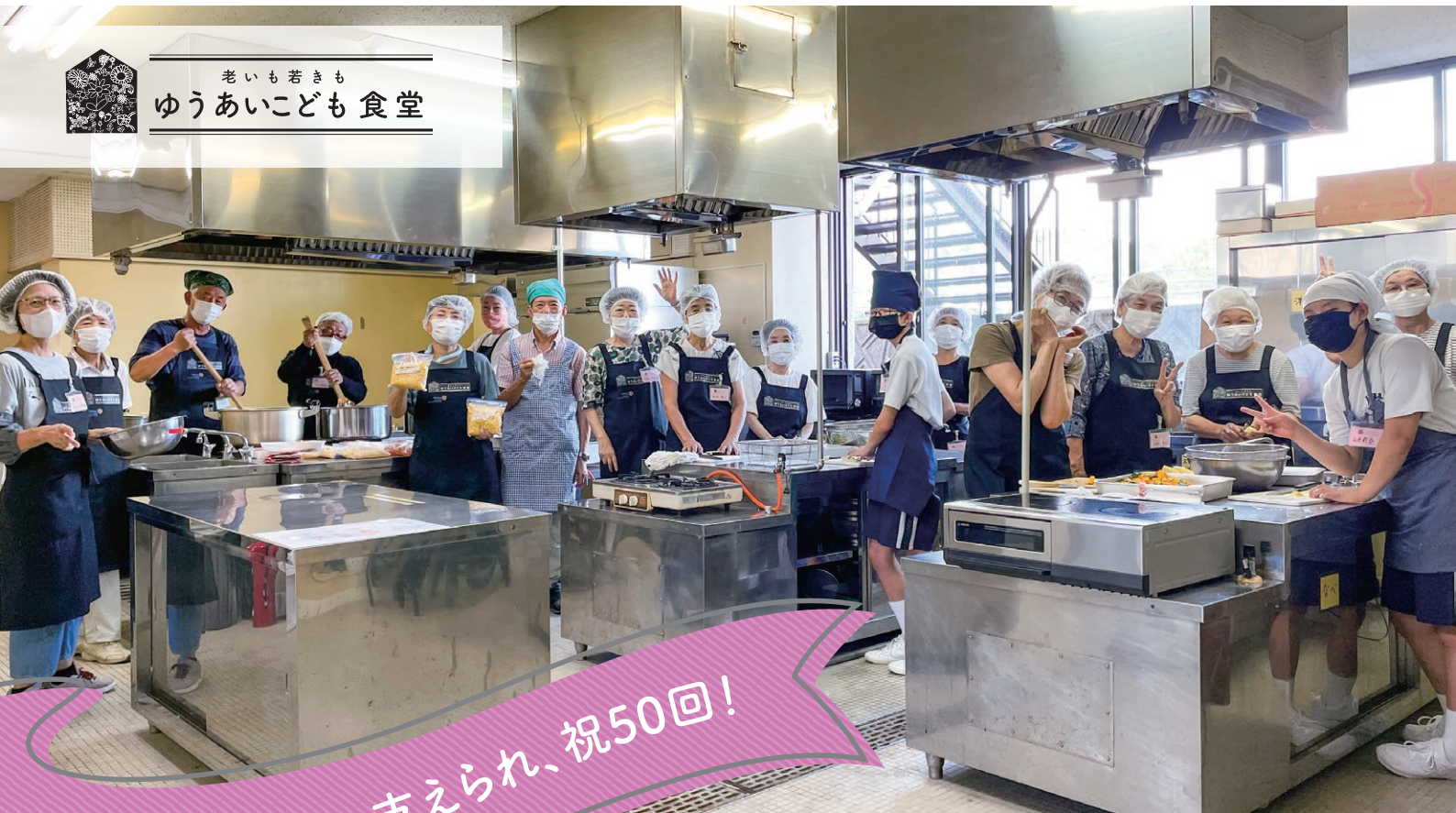
老いも若きも ゆうあい子ども食堂