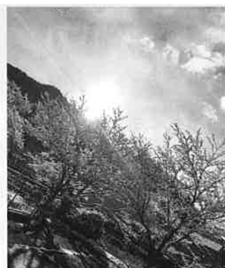
今回のカメラあぐるはそのランニング時に撮った朝日の写真です。