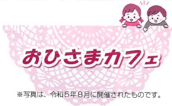
※写真は、令和5年8月に開催されたものです。