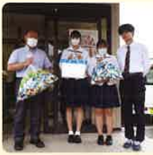
山口県立高森高等学校・高森みどり中学校 様

(物品寄付) 山口県立高森高等学校・高森みどり中学校 様 エコキヤップ・古切手 様