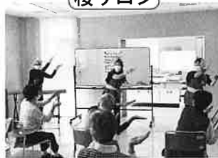
銭太鼓で元気出しましょー美和っ子