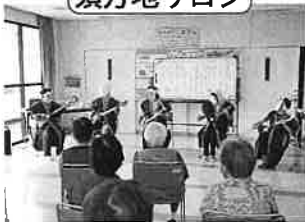
錦レクリエーション愛好会