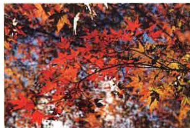
錦の秋は紅葉です