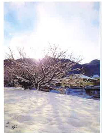
錦公民館の裏です 今年も雪がたくさん降りましたね