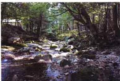
真夏の寂地峡です