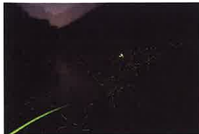
深須のゲートボール場です きれいな蛍を見ることができます