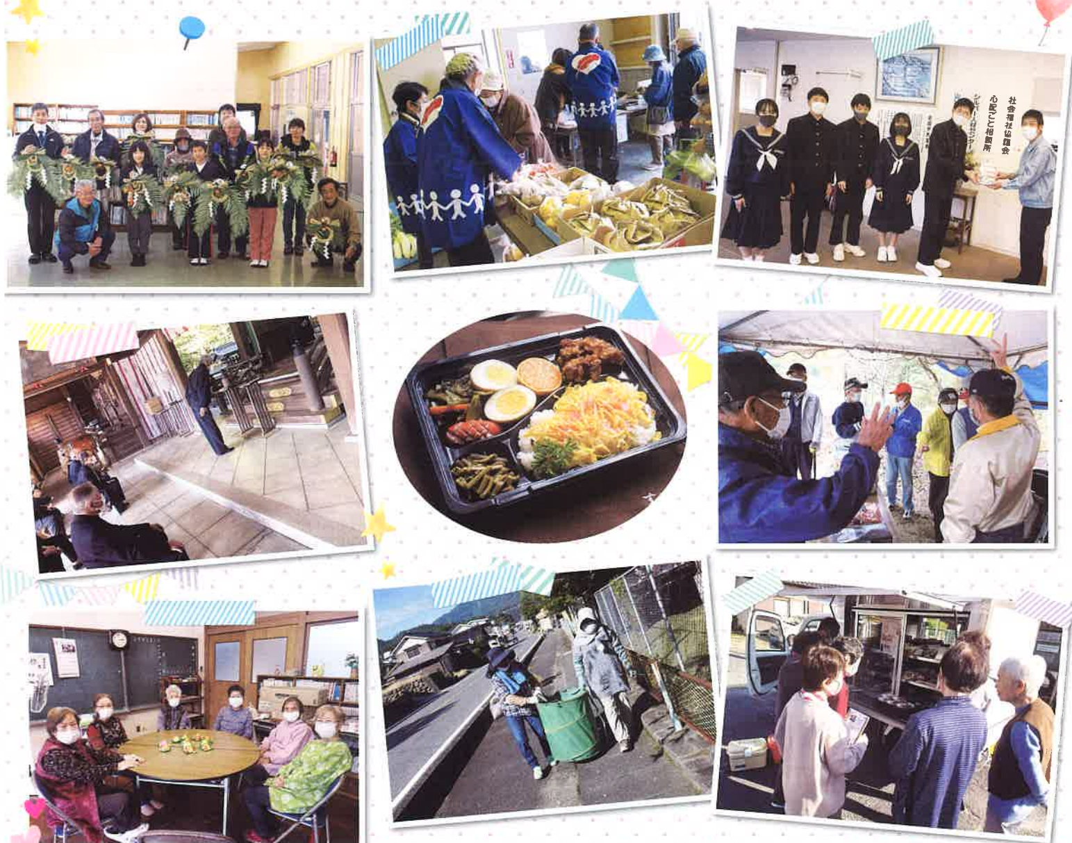
※上記の写真は令和3年度実際の活動の一部です。