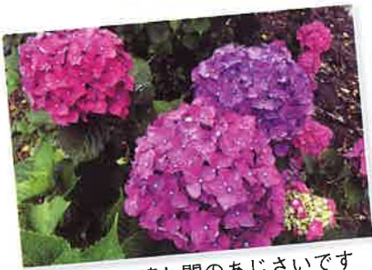
梅雨の晴れ間のあじさいです

この1年、職員が錦町内で撮影した写真を集めてみました。この春もきれいな景色が見られると思うので、お散歩を試してみるのもいいのかもしれないね。