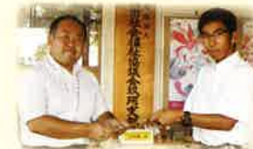
〈山口県立高森高等学校家庭クラブ様〉