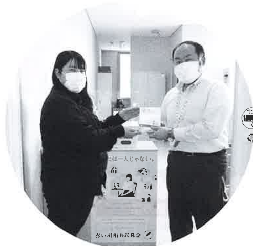
岩国市立玖珂中学校の皆様より 1,221円の募金をいただきました。