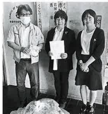
明治安田生命保険(相)岩国営業所 様