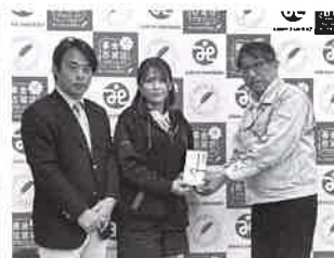
山口県東部ヤクルト販売(株) 様