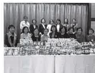
国際ソロプチミスト岩国 様