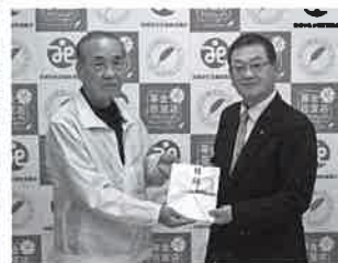
(公社)岩国市シルバー人材センター 様