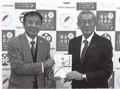
肉のきくがわ杯 チャリティゴルフ 様