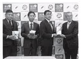
(一社)岩国法人会 様