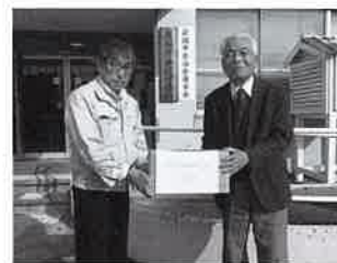
岩国市老人クラブ連合会 岩国支部 様