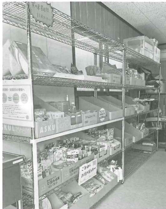
いわくにステーションに寄付された食品

令和5年10月3日(火)、岩国市内の21の社会福祉法人で組織する「岩国市社会福祉法人地域公益活動推進協議会(略称、公益協)」が運営者となり、企業からの資金援助等も受け、NPO法人フードバンク山口のいわくにステーションが岩国市錦見に開設しました。