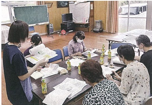
皆様と情報共有ができました

9月3日(火)、府谷集会所にて「にしきまちご近所ささえ合い会議」を開催しました。 今回は、西村・瀬戸・大久保・渋谷地区の民生委員・福祉員・岩国第五包括支援センター職員の皆様にご参加いただき、府谷地域にお住いの高齢者について情報共有を行いました。 会議で出た情報をうまく活用して課題解決に向けた助け合いの仕組みを作っていきます。